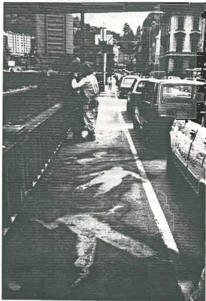
L'art dans la ville...