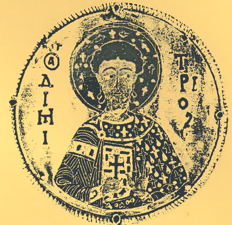
Médaille de saint Démétrios, XIIe siècle.

■ Pour la première fois les objets les plus précieux commémorant le règne "Aménophis III, le Pharaon-Soleil" (le