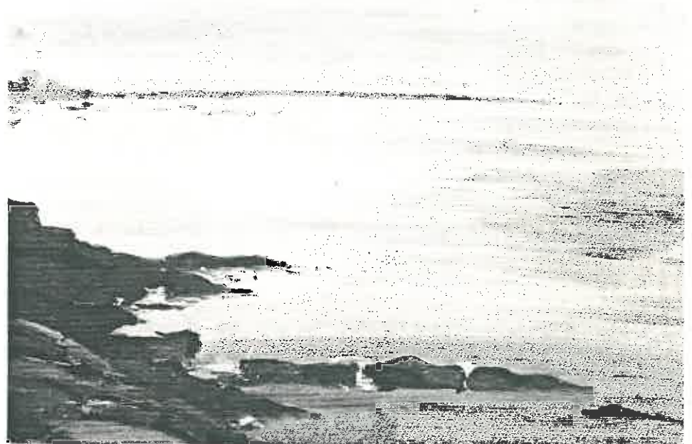
"MAREE BASSE" Gouache de Mihaela Constantin

"Du Danube à la Seine, Paysages au fil de l'eau"