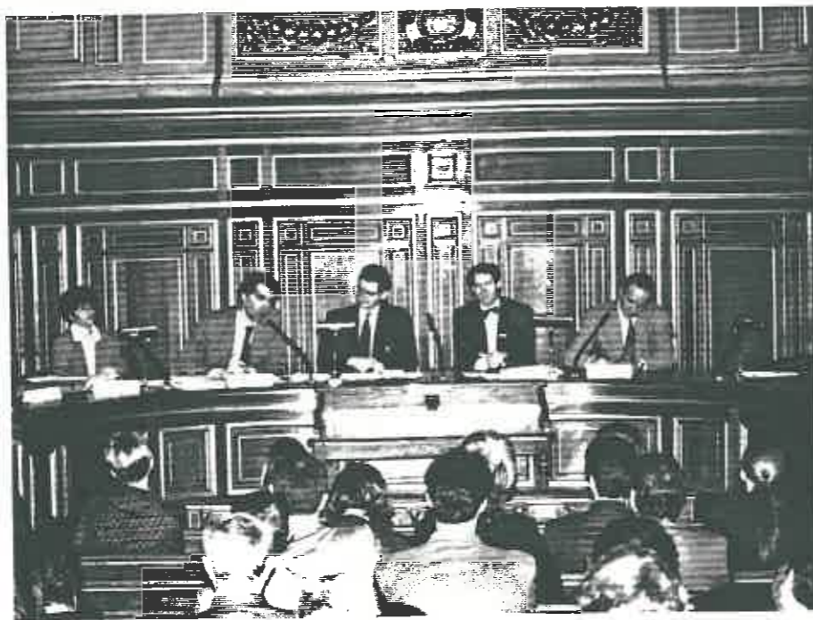
Le DESS Communication audiovisuelle en Sorbonne