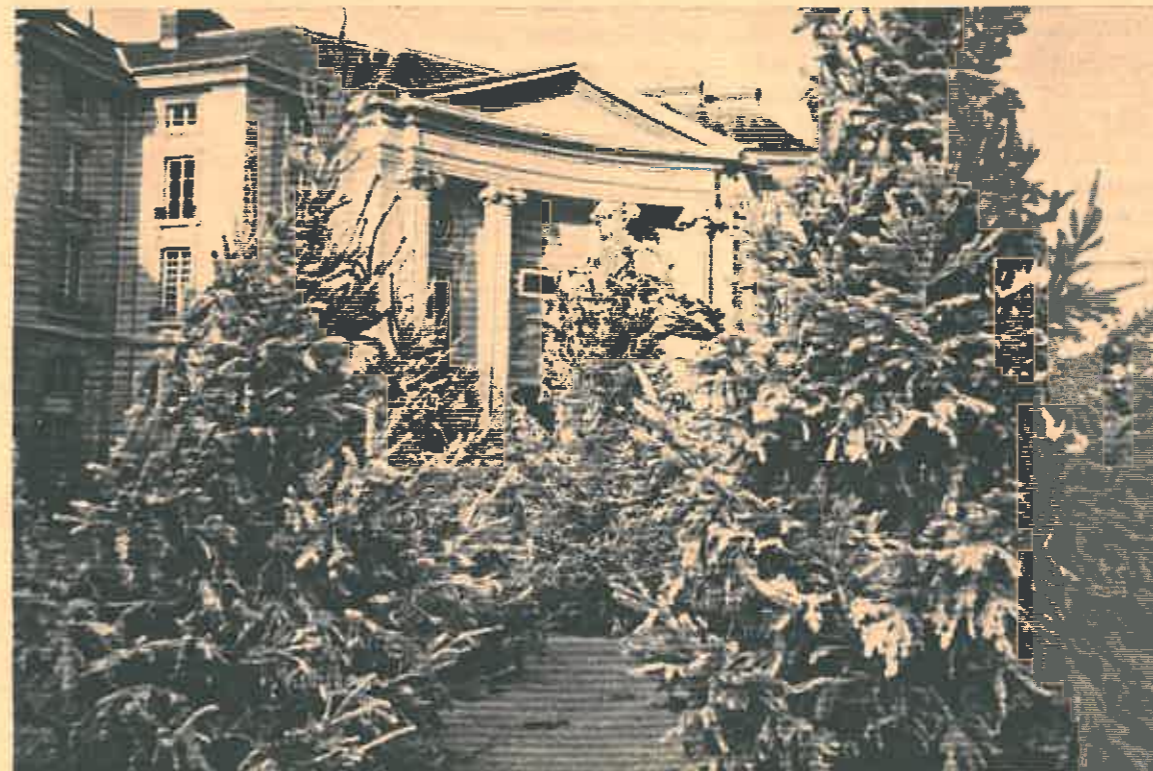
Le Panthéon en hiver ...