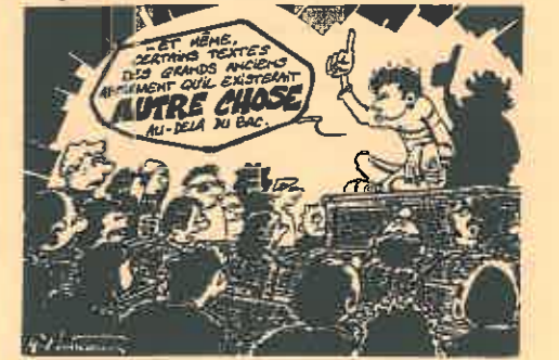
L'Etudiant, juin 1991