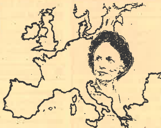
Démocratie sans frontières ...