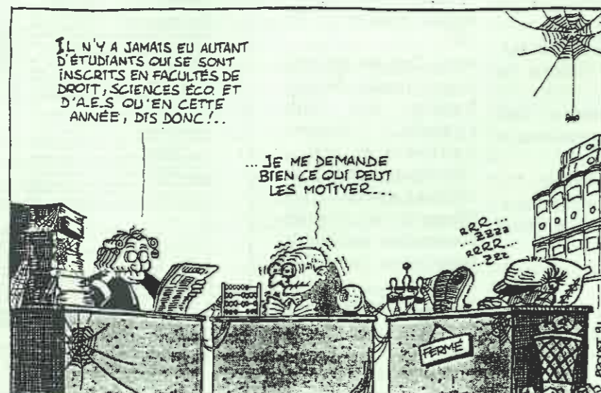
Transfac septembre 91 n°18

Contact : Centre Malher, 9 rue Malher 75004, tel : 42 78 33 22.